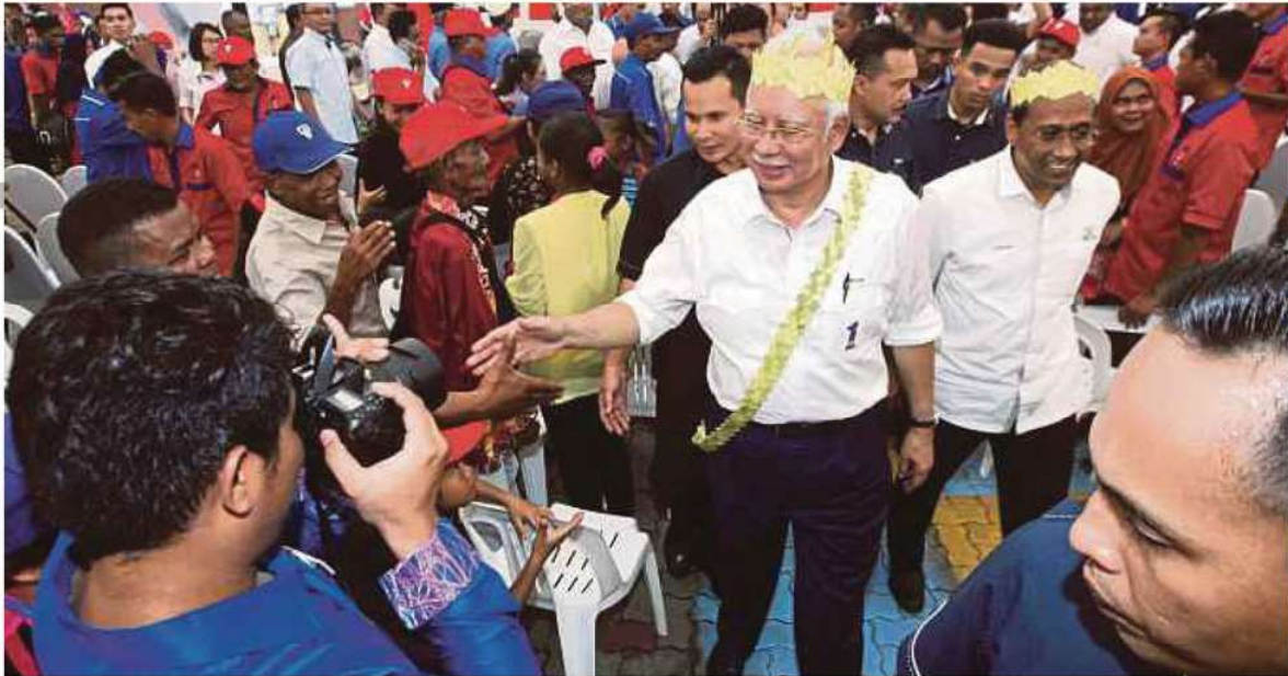
NAJIB bersalaman dengan masyarakat Orang Asli ketika tiba di Program Lawatan Kerja dan Ramah Mesra Bersama-sama Masyarakat Orang Asli Parlimen Pekan di Sekolah Kebangsaan Kampung Simpai.