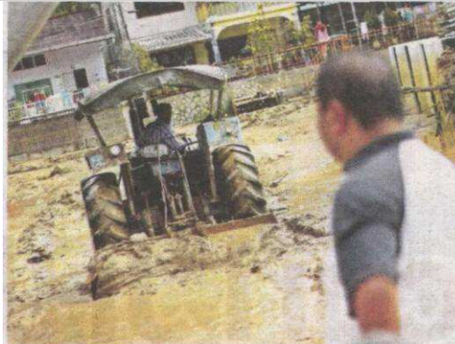
SEORANG penduduk melihat kerja-kerja membersihkan lumpur angkara banjir kilat di Lembah Bertam.