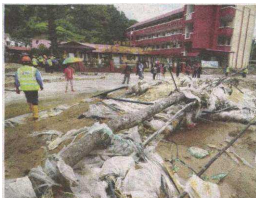
KESAN kemusnahan berhampiran SJKC Bertam Valley akibat banjir kilat di Lembah Bertam Rabu lalu.