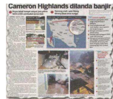
KERATAN Kosmo! 6 November 2014.