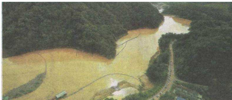
EMPANGAN Sultan Abu Bakar di Ringlet, Cameron Highlands.