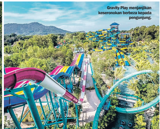
Gravity Play menjanjikan keseronokan berbeza kepada pengunjung.