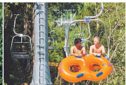
Ski lift turut disediakan untuk pengunjung mendaki bukit untuk ke Gravity Play.