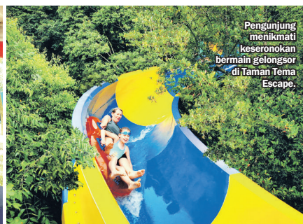
Pengunjung menikmati keseronokan bermain gelongsor di Taman Tema Escape.