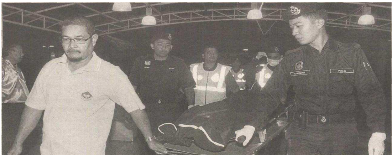
MAYAT mangsa dibawa ke Rumah Mayat HTF untuk dibedah siasat.