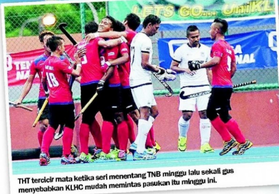
THT tercibir mata ketika seri menentang TNB minggu lalu sekali gus menyebabkan KLHC mudah memintas pasukan itu minggu ini.

KLHC kini mengumpul 29 mata berbanding THT di tangga kedua dengan 27 mata.