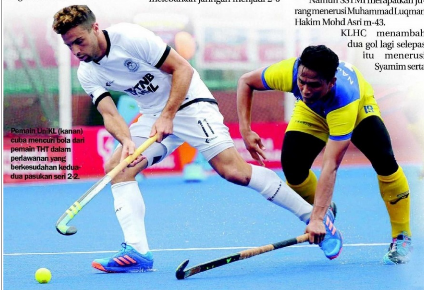
Pemain UniKL (kanan) cuba mencuri bola dari pemain THT dalam perlawanan yang berkesudahan kedua-dua pasukan seri 2-2.

"Tetapi kami tetap perlu terus fokus untuk tiga perlawanan terakhir kami yang dilihat amat sukar," katanya.