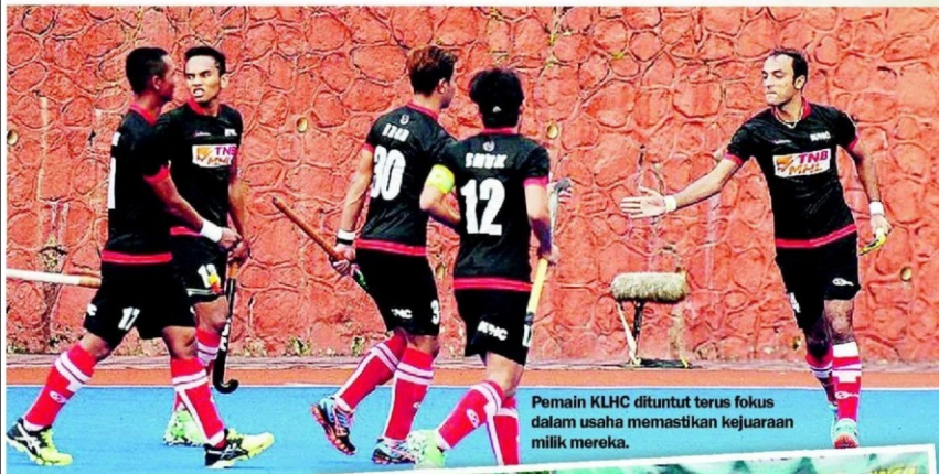
Pemain KLHC dituntut terus fokus dalam usaha memastikan kejuaraan milik mereka.

KELAB Hoki Kuala Lumpur (KLHC) dan penyandang juara Pasukan Hoki Terengganu (THT) kini bersaing sengit bagi menentukan pasukan yang lebih layak menjuarai Liga Hoki Kebangsaan (TNBMHL) 2017 dengan saingan berbakat tiga perlawanan.