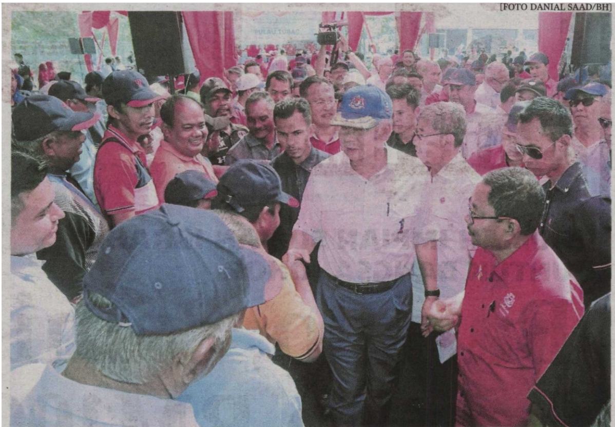
Najib beramah mesra dengan penduduk Pulau Tuba sebelum merasmikan Projek Bekalan Elektrik Luar Bandar Melalui Sistem Grid (Bekalan 24 Jam) di Pulau Tuba, Langkawi.