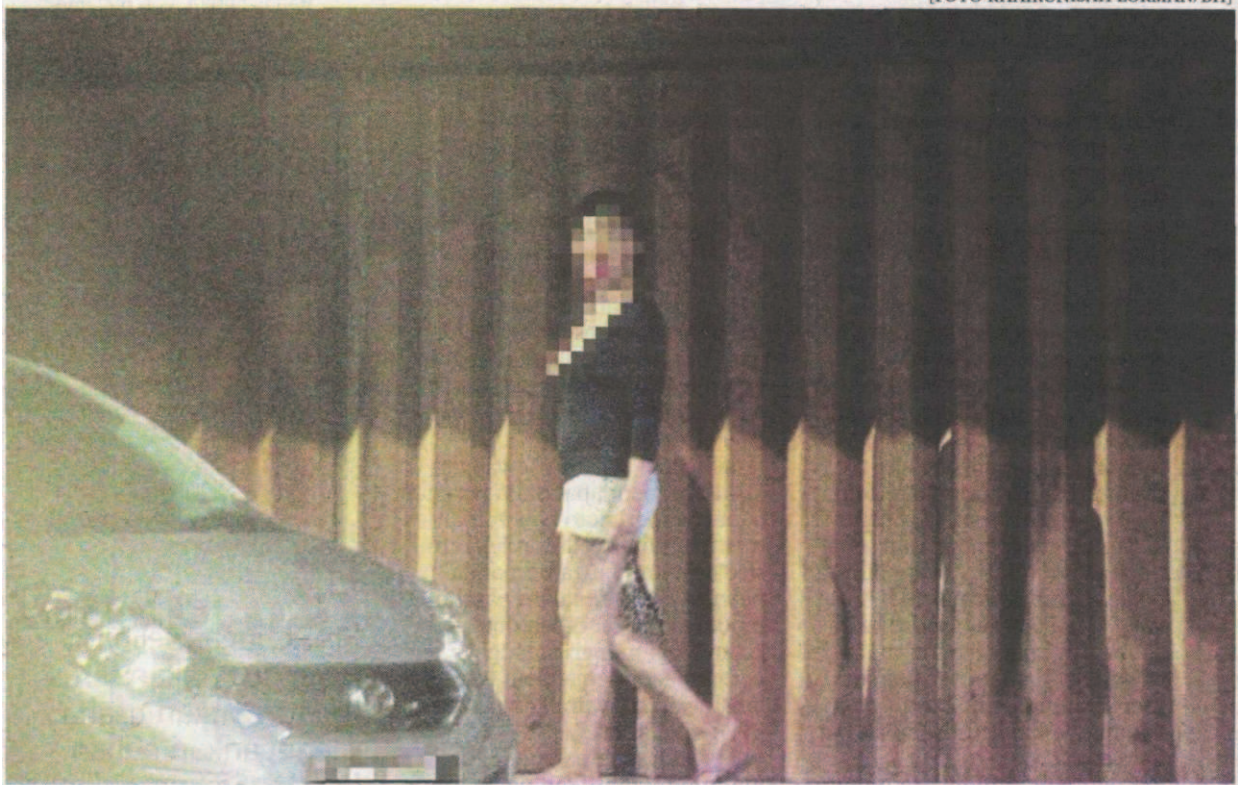
Individu dipercayai terbabit kegiatan tidak bermoral mencari pelanggan di Jalan Tun Ali, Melaka.