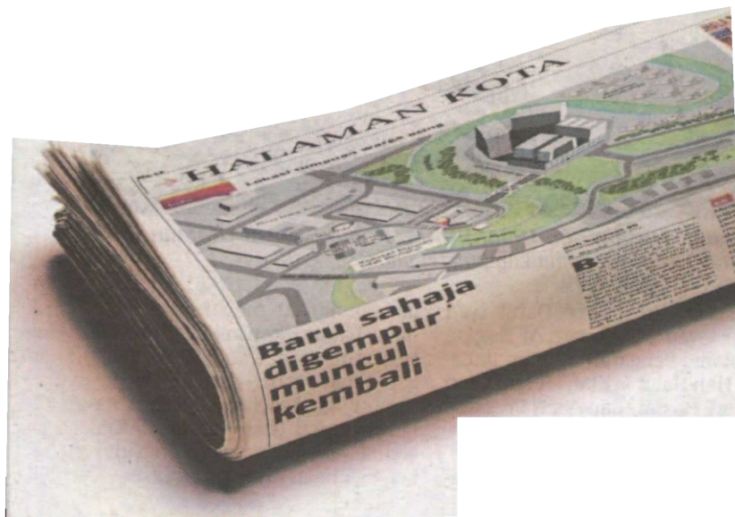
Keratan akhbar BH, semalam.