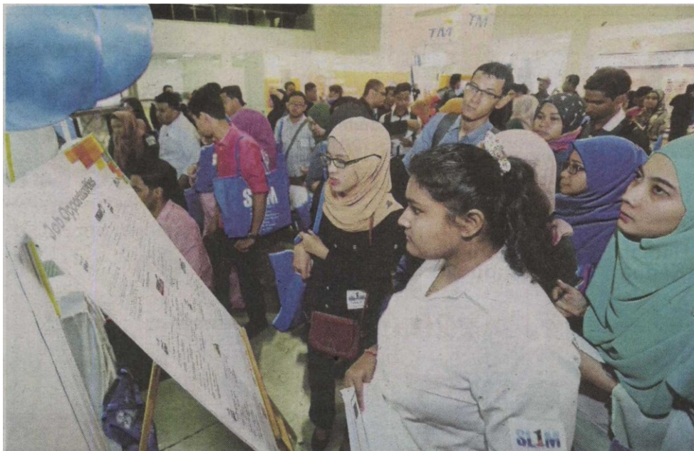
GRADUAN meneliti jawatan kosong yang ditawarkan.