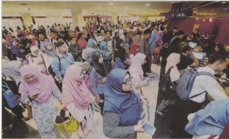
GRADUAN mendaftarkan diri di kaunter pendaftaran SL1M.