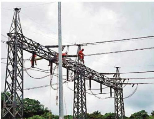
输电线路整个工程预计将在 4 月中旬全面投入运作。

他强调, 沙电将在开斋节前完成所有升级工作, 以确保节日期间供电稳定, 满足高峰负荷需求。