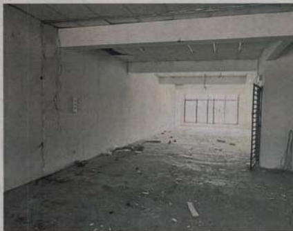
■业主申诉，单位遭到不同程度的破坏。