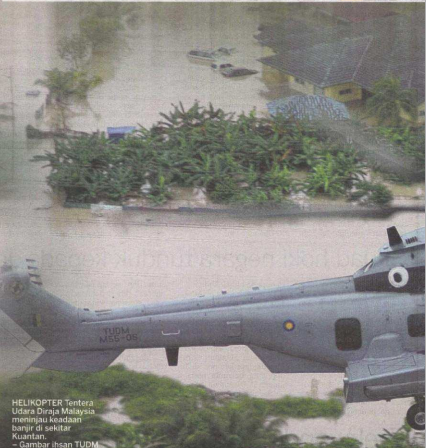
HELIKOPTER Tentera Udara Diraja Malaysia meninjau keadaan banjir di sekitar Kuantan.