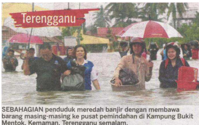
SEBAHAGIAN penduduk meredah banjir dengan membawa barang masing-masing ke pusat pemindahan di Kampung Bukit Mentok, Kemaman, Terengganu semalam.

Di Melaka , sejumlah 25 mangsa di Kampung Parit Penghulu Benteng, Sungai Rambai dipindahkan ke pusat pemindahan di Sekolah Kebangsaan Parit Penghulu, Sungai Rambai, Jasin apabila air Sungai Kesang melimpah dan memasuki rumah mereka.